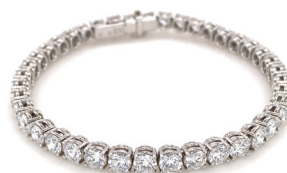
Tennis Bracelet: 4.00-4.10 mm, 10.5 carat Preis = ca. 18'900.- CHF inkl. Mwst Minen-Diamanten Preis = ca. 100'000.-