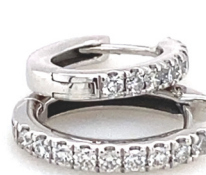
Creolen Oval: 1.4 cm Länge 18 Brillanten mit 1.6 mm Durchmesser Preis = 2'300.- CHF inkl. Mwst Einhänger für Creolen möglich