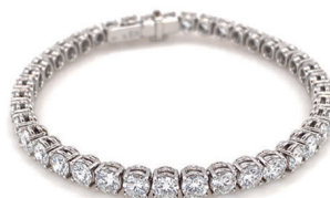
Tennis Bracelet: 4.00-4.10 mm, 10.5 carat Preis = ca. 18'900.– CHF inkl. Mwst Minen-Diamanten Preis = ca. 100'000.–