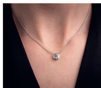
Halskette & Anhänger: 1 carat G VVS Preis = ca. 6'000.– CHF inkl. Mwst Minen-Diamanten Preis = ca. 28'000.–

Verpackungsmaterialien sind aus umweltfreundlichen Materialien. Unsere Designer, Goldschmiede und Steinfasser sind in unserem Atelier in der Schweiz. Wir legen höchsten Wert auf exzellente Qualität «Swiss Made». Wir arbeiten mit modernsten Technologien wie CAD-3D-Computer Visualisierung. Wir sind eine Schweizer Luxusmarke mit attraktiven Preisen!