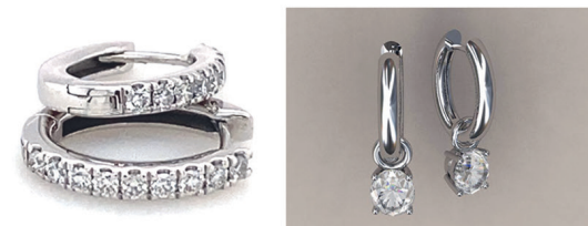
Creolen Oval: 1.4 cm Länge 18 Brillanten mit 1.6 mm Durchmesser Preis = 2'300.– CHF inkl. Mwst Einhänger für Creolen möglich